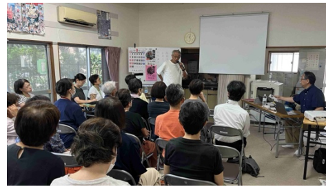
大勢の方にご参加いただきました

大正の関東大地震後、約100年が経過していますが、相模トラフ・関東各地の数ある活断層では、エネルギーが貯められており、今後30年以内に大地震が発生する確率は70%と言われています。最近の関東での地震数は、全国で一番多いと言われており、明日・今年・来年に大地震の可能性もあると言えます。