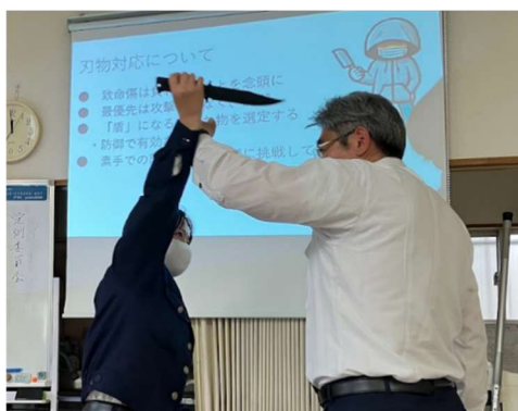
〔刃物対応について〕